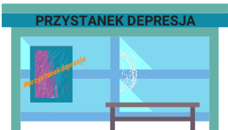
MAPA PUNKTÓW POMOCY